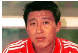
48岁前国脚去世细节曝光! 生日当晚赶了两场酒局, 回家...