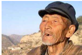
老人拿一把菜刀鉴宝, 遭受观众嘲笑, 专家激动问道: 祖...