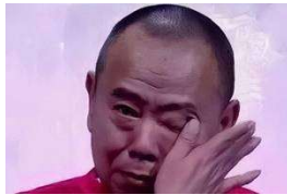
潘长江事件再度恶化, 女儿潘阳也深受其害, 网络暴力真...