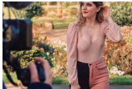
英国23岁女孩的罕见病症: 一边A罩杯! 一边则是D罩杯