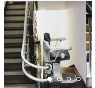
家用电梯别墅电梯