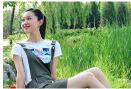
18岁女孩失踪10个月后陈尸野外, 身上残留男性DNA