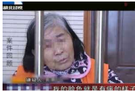
六旬老人交十几个男友, 每天带不同老人回家 一老人承受...